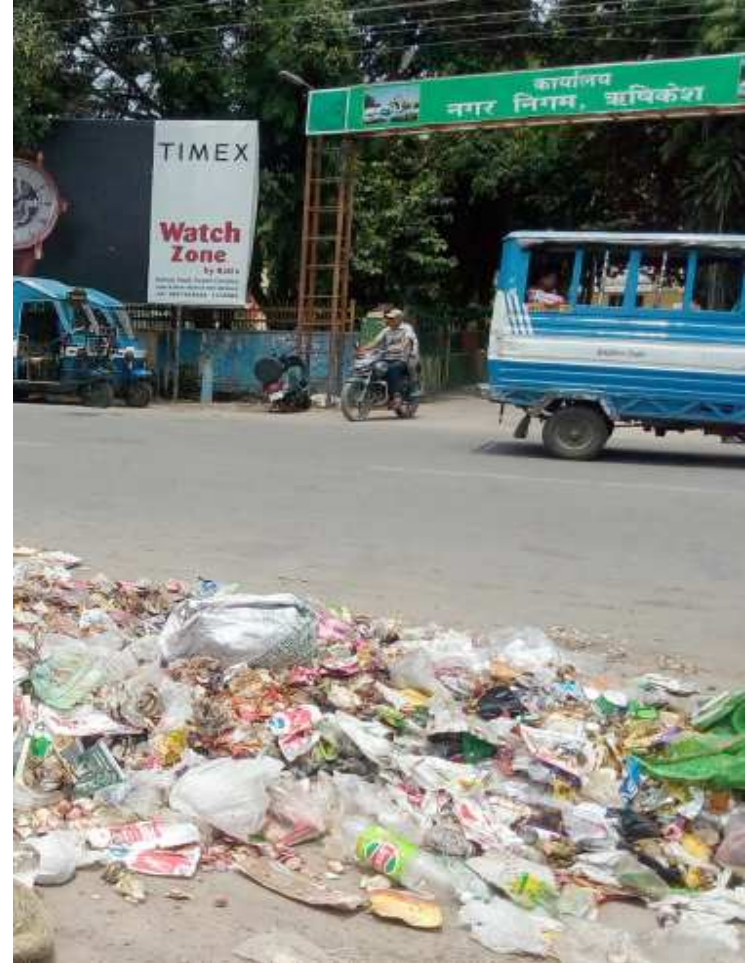
हरिद्वार रोड स्थित निगम कार्यालय के ठीक सामने सफाई व्यवस्था की पोल खोलती कूड़े के ढेर की तस्वीर।

जगह जगह कूड़ा कर्कट बिखरा नजर आता है। नगर की मलीन बस्तियों में तो सफाई व्यवस्था इस हद तक पटरी से उतर चुकी है कि लोगों को अब नारकीय जीवन जीने को विवश होना पड़ रहा है। शहर के हरिद्वार रोड पर एक खाली भूखंड में वर्षों से कूड़ा डाला जा रहा। यहां हजारों मैट्रिक टन कूड़े का पहाड़ इकट्ठा हो चुका है लेकिन इसके निस्तारण के लिए निगम प्रशासन के पास कोई योजना ही नहीं है।